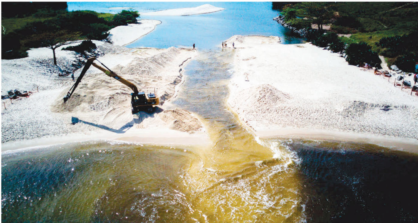
Alex Ramos / Divulgação

O projeto definitivo deve ser lançado ainda no mês de setembro. Página 3