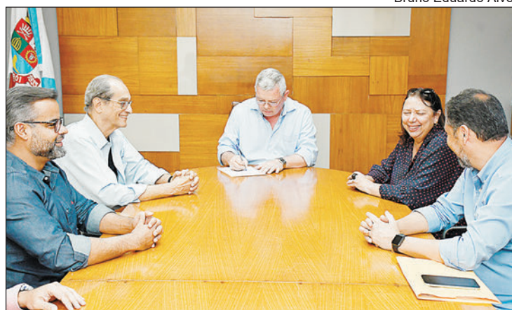
O prefeito autorizou a elaboração do projeto básico de reurbanização da orla