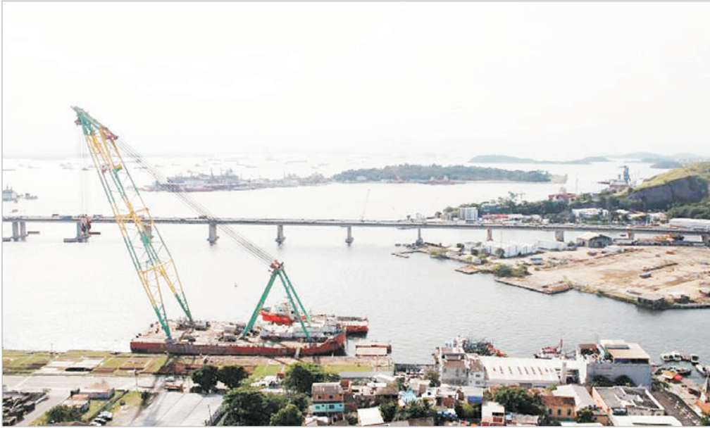
Desassoreamento permitirá passagem de grandes embarcações