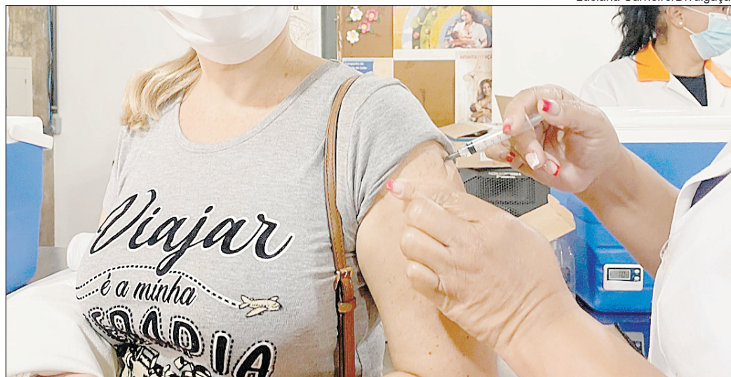
A quarta dose também é destinada para profissionais e trabalhadores da saúde

A Moeda Social Arariboia completou R$ 50 milhões em vendas, injetados diretamente na economia da cidade. O programa de transferência de renda permanente está perto de chegar à marca das 700 mil transações nesses cinco meses de circulação no comércio. A moeda social é uma aposta do governo municipal na retomada econômica e no auxílio da população em vulnerabilidade social.