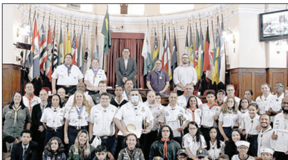
Sessão Solene de Homenagens da Comissão Permanente de Esporte e Lazer da Câmara