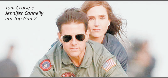
Tom Cruise e Jennifer Connelly em Top Gun 2