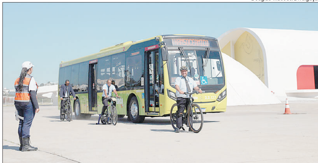
Treinamento contou com cerca de 100 motoristas de diversas empresas de ônibus de Niterói

A Prefeitura assinou um termo de cooperação com a Prefeitura do Rio para implementação do aplicativo Taxi.Rio Cidades em Niterói. O aplicativo, que já pode ser baixado no celular dos usuários, permite que o passageiro solicite um táxi com até 40% de desconto na corrida. A ferramenta já está disponível para os 2.500 taxistas.