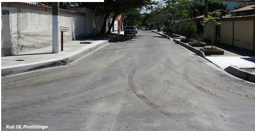
Rua 18, Piratininga