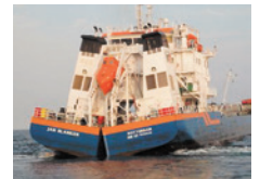
Embarcação transporta os sedimentos dragados para descarte no mar em área indicada pelo Inea

Caso a Justiça defira a liminar, os réus estão sujeitos à multa diária de R$ 100 mil se descumprirem a determinação. Entre os principais pedidos veiculados na ação, destacam-se: a paralisação dos descartes marítimos até a conclusão da Avaliação Ambiental Integrada (AAI), inclusive com a complementação dos estudos referentes ao diagnóstico da área afetada e ao prognóstico dos impactos; a implantação de um Modelo de Gestão Participativa com integrantes de órgãos e segmentos interessados, inclusive pescadores, para acompanhar com transparência o transporte e despejo do material dragado; e que os descartes não autorizados, que tenham