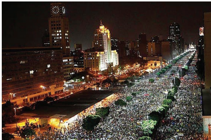
Manifestação na Av. Presidente Vargas - 20/06/2013