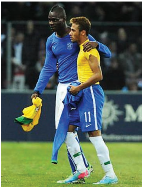
Balotelli com Neymar no último encontro das seleções, em março