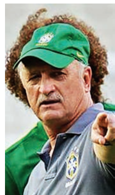
Luiz Felipe Scolari