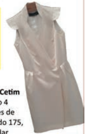
Blusa Cetim Tempo 4 Tavares de Macedo 175, 2º andar Tel: 2705-2458