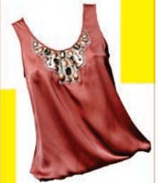
Vestido Coucou Marycota Lopes Trovão 110/201 Tel: 2610-7808