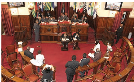
Sessão plenária na Câmara

Conforme a justificativa encaminhada pelo prefeito, o Escritório de Gestão será um órgão técnico de assessoramento para a execução de projetos estratégicos,