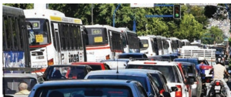
Além dos engarrafamentos, a longa distância percorrida pode desenvolver estresse na criança

Estudantes não precisam mais 'migrar' para escolas da zona sul