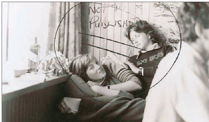
Foto 'impuplicável' da Princesa Diana será leiloadada nos EUA