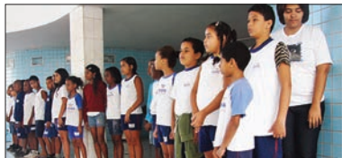
Participação dos alunos da rede municipal de ensino