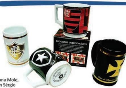
Canecas do time do coração A partir de R$29,95 UD Mix Icaraí, Tel. 2610-3398