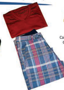
Camisa Fio Escócia gola V (Vinho) R$39,90 Bermuda dupla face R$119,00 Christi, Tel. 2714-1600