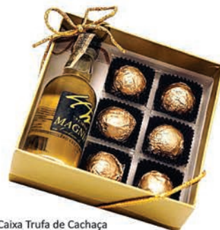
Caixa Trufa de Cachaça Chez BonBon Icaraí Tel. 2610-0577