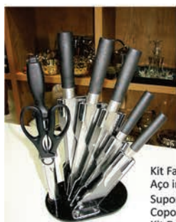
Kit Facas (7 peças) Aço inox R$169,00 Suporte de vinho aço Inox R$92,00 Copos para cerveja (6 peças) R$149,00 Kit Drinks (copos) R$69,00 Casa Blanca, Tel. 2704-0306