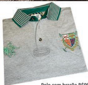
Polo com braço R$99,00 Christi, Tel. 2714-1600