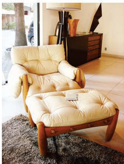
Poltrona Mole, design Sérgio Rodrigues Way Design Tel. 2710-1512