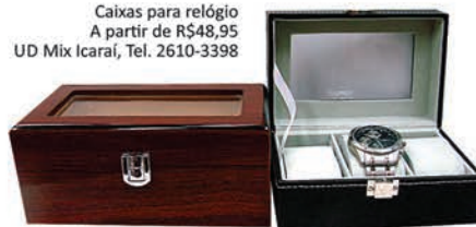
Caixas para relógio A partir de R$48,95 UD Mix Icaraí, Tel. 2610-3398