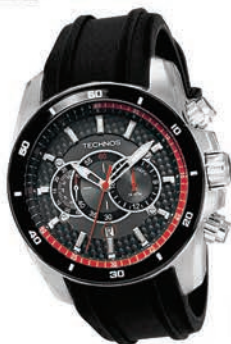
Relógio Technos Caixa de aço. Pulseira de silicone e cronógrafo Celeni Presentes Tel. 2717-8043