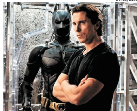
Christian Bale ressurge como Batman nas telonas

Encontro de Lutheria. A mostra é composta de violão, banjo, cavaquinho, flauta transversa e flautim moderno, brindando o público com todo o processo de construção de cada elemento sonoro. Até 31/7. Terça a sexta, das 10h às 18h; e sábado e domingo, das 15h às 18h. Sala Carlos Couto: Rua XV de Novembro, 35 – Centro. Tel.: 2620-1624. Gratuito. Classificação: Livre.