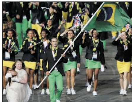
Delegação brasileira na abertura dos jogos