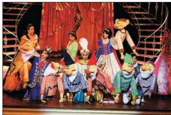
O Baile das Princesas.

O Baile das Princesas. Com Jorge Azevedo. Reunião dos clássicos infantis num único espetáculo. Cinderela vai ser coroada e, para isso, uma grande festa será realizada, onde todas as princesas e seus respectivos príncipes foram convidados. Espaço Cultural AMF, Teatro Eduardo Kraichete: Avenida Roberto Silveira, 123 – Icaraí. Tel.: 2710-1549. Sábados e domingos, às 16h. Até 25/9. R$ 30. Classificação: Livre.