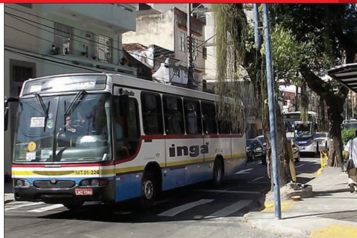
Rua São João tem fluxo intenso de ônibus

Para atrair médicos às regiões mais carentes do Brasil, o governo federal dá abatimento de até 100% a profissionais que utilizaram o crédito do Fundo de Financiamento ao Estudante do Ensino Superior (FIES) para se formar. Para isso, eles precisam optar por atuar na Atenção Básica, em um dos 2.282 municípios definidos pelo Ministério da Saúde. Os recém-formados que preferirem fazer residência médica em uma das 16 áreas prioritárias definidas terão extensão do prazo de carência do Fies. A determinação consta na Portaria conjunta nº2, publicada no Diário Oficial da União. Mais informações em http://portalsau.de.saude.gov.br/portalsau.de/ .