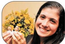
Casa das Delicias