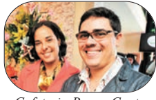
Cafeteria Bruno Couto