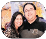
Cláudio Bastos Gastronomia