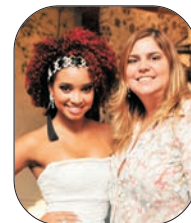
Centro Avançado de Estética Kátia Ferreira