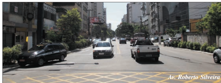
Av. Roberto Silveira

A primeira fase do Plano de Transporte da Prefeitura de Niterói, elaborado pela Nittrans, visa a diminuição no tempo de percurso entre o Largo da Batalha e o Centro, proporcionando aos moradores de Pendotiba, São Francisco, Icaraí e outros bairros um transporte público de qualidade. Vários pontos do percurso estão sendo preparados, com obras e adequações viárias, para viabilizar a implantação do Plano, principalmente a avenida Rui Barbosa,