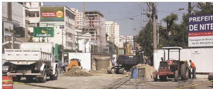
Segunda fase das obras do mergulhão na Marquês do Paraná