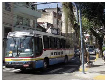
Ônibus são obrigados a usar a Rua São João

O trânsito procedente da Ponte e da Zona Norte, pela Avenida Jansem de Mello, segue pela Rua São João,