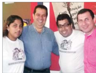
Flávia Quadros, Carlos Lupi, Márcio Luiz e Felipe Peixoto

Líderes da União Metropolitana dos Estudantes do Estado do Rio de Janeiro (UMES-RJ) se encontraram, no dia 13, com o secretário de Estado de Abastecimento, Pesca e Desenvolvimento Regional, Felipe Peixoto, e o ministro do Trabalho e Emprego, Carlos Lupi, para conversar sobre educação, qualificação profissional, mercado de trabalho, políticas públicas para mulheres, Comperj, dentre outros. De acordo os representantes da UMES, o secretário e o ministro garantiram que Niterói, assim como os demais municípios da Região Leste Fluminense, é prioridade para a presidenta Dilma Rousseff e o governador Sérgio Cabral.