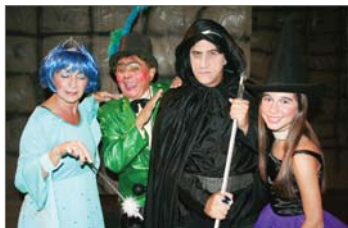
Sabrina, a Bruxinha Cantora