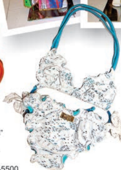
Biquini Renda R$81,00 Mini Beni, tel. 3617-5333