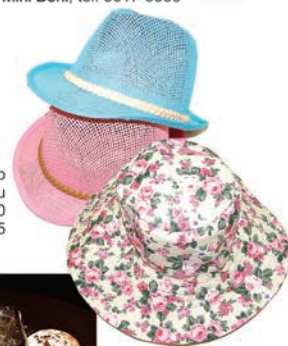
Chapéu colorido tela R$20,00 e Chapéu tecido Floral R$55,00 Themura, tel. 2705-2715