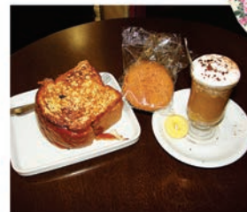
Torrada Petrópolis R$4,00 Cappuccino R$5,80 Bolinho de Laranja R$1,50 Icaraí Café, tel. 2714-4473