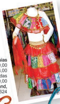
Fantasia Bailarina 189,00 Cigana R$198,00 Segredo das fadas R$259,00 Kids Land, tel. 2610-7624