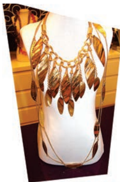
Colar Dourado Folhas de R$185,00 por R$129,50 Amabili, tel. 2711-3034

O Center Icaraí apresenta o Center Mix, uma remarkação de preço em todas as lojas do shopping, com preços até 70% mais baratos. Passe lá e confira. Center Icaraí: Rua Cel. Moreira César, 265 - Icaraí.