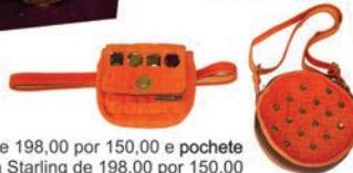
Bolsa de 198,00 por 150,00 e pochete Bruna Starling de 198,00 por 150,00 Casa Duqué, tel. 2610-3576