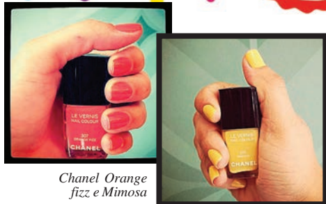
Chanel Orange fizz e Mimosa