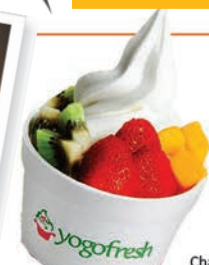
Sorvete Yogofresh a partir de R$6,00 Yogofresh, tel. 3619-1229