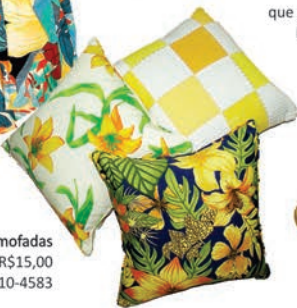
Capas para almofadas a partir de R$15,00 Teoria, tel. 2710-4583