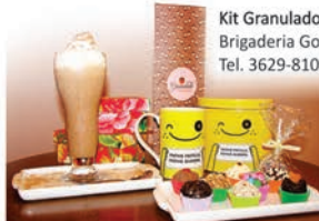
Kit Granulado Brigaderia Gourmet Tel. 3629-8109