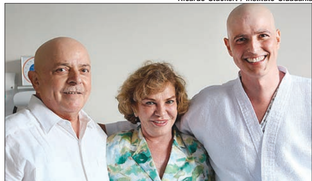
Ricardo Stuckert / Instituto Cidadania