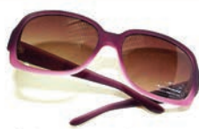
Óculos Jean Marcel Lente UV 400 R$ 280,00, Ótica D'Franco, tel. 3628-2355