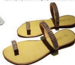
Sandália Verão com Strass Via Curtume, tel. 2629-1178