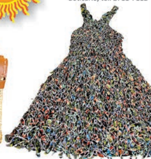
Vestido Homem de Barro que tem como tema a poeta Cora Coralina R$990,00, Casa Duquê, tel. 2610-3576