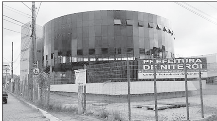
Museu do Cinema está quase concluído