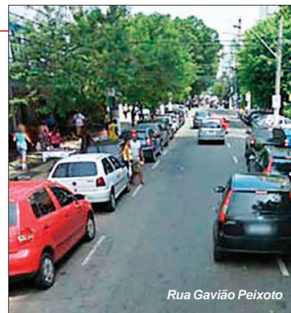
Rua Gavião Peixoto

A medida que as intervenções previstas forem sendo implantadas, serão demarcados os circuitos previstos para a circulação de ciclistas. As ciclo faixas e ciclo rotas serão sinalizadas com pintura horizontal e placas verticais, nos trechos destinados ao uso compartilhado dos ciclistas com demais veículos em trânsito, na maior parte das ruas de Icaraí e Santa Rosa.