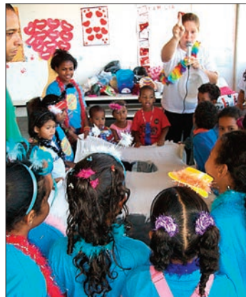
Férias Nota 10: Momentos de muita brincadeira e alegria

O Programa Férias Nota 10 tem o objetivo de desenvolver atividades lúdico-pedagógicas, esportivas e artísticas, além de reforçar e garantir os níveis nutricionais dos alunos da Rede Municipal de Ensino de Niterói, durante o período de férias e recesso escolar, bem como diminuir os índices de evasão e integrar a comunidade escolar.