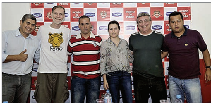
Feijoadas com iogurte

Atualmente a Câmara dispõe de 18 vereadores que, segundo o presidente Paulo Bagueira, estão atendendo aos anseios do eleitor. Entretanto, o tema divide a opinião dos representantes. De acordo com os primeiros estudos realizados pelos próprios vereadores, Niterói está apta a ter de 18 a 25 legisladores, pois se encontra na faixa populacional de 450 a 600 mil habitantes.