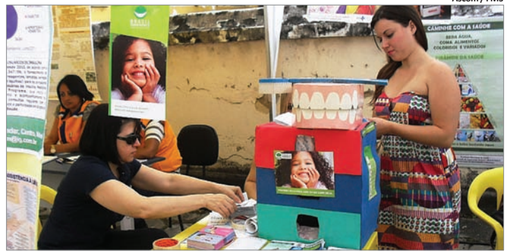
Ascom / FMS