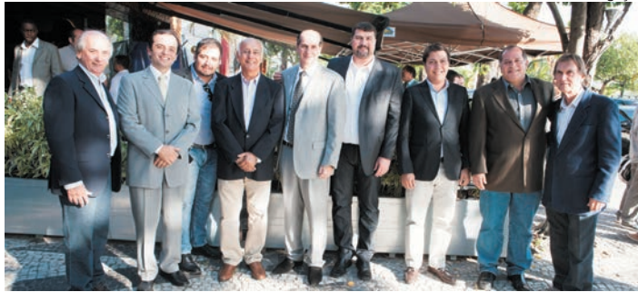
Integrantes da nova diretoria do Sindicato dos Lojistas

Prestigiada com as presenças de expressivas lideranças políticas e classistas e de grande número de empresários tradicionais da cidade, a diretoria eleita para a gestão 2014/2018 do Sindicato dos Lojistas do Comércio de Niterói (Sindilojas Niterói) tomou posse em solenidade realizada terça-feira, dia 13, em almoço no restaurante Paludo, em São Francisco.