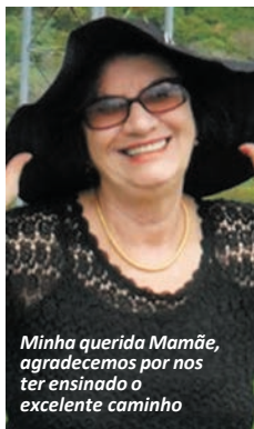
Minha querida Mamãe, agradecemos por nos ter ensinado o excelente caminho