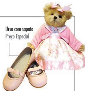
Ursa com sapato Preço Especial