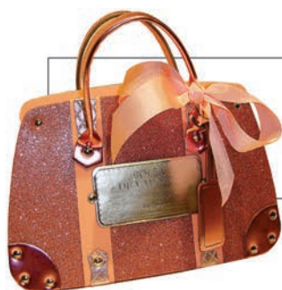
Bolsa de Valores RS 189,90