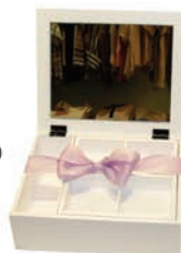
Caixa de jóias RS139,90