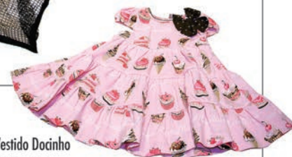
Vestido Docinho RS 219,90