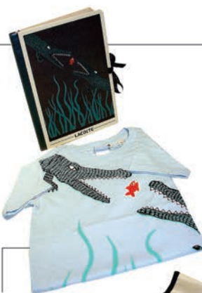
Camisa Lacoste + livro RS139,90