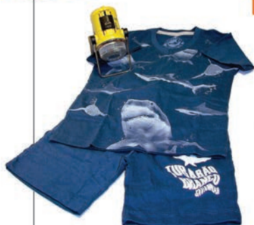
Pijama - Brilha no escuro RS99,90