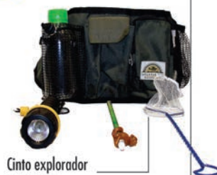
Cinto explorador RS129,90