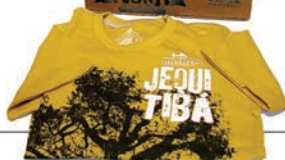
Kit Savana Caixa RS79,90