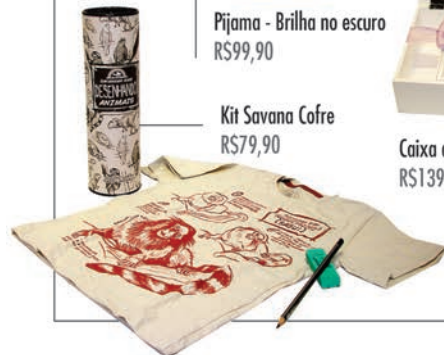
Kit Savana Cofre RS79,90