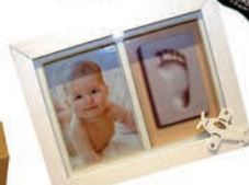
Porta retrato Pézinho RS159,90