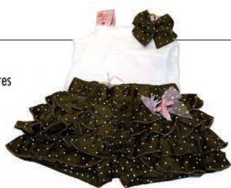
Conjunto Short Poá RS 299,90